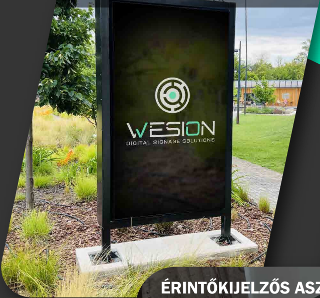
KÜLTÉRI KIJELZŐ (Vandálbiztos, időjárásálló)