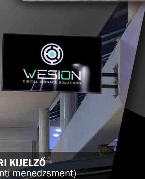
BELTÉRI KIJELZŐ (Központi menedzsment)